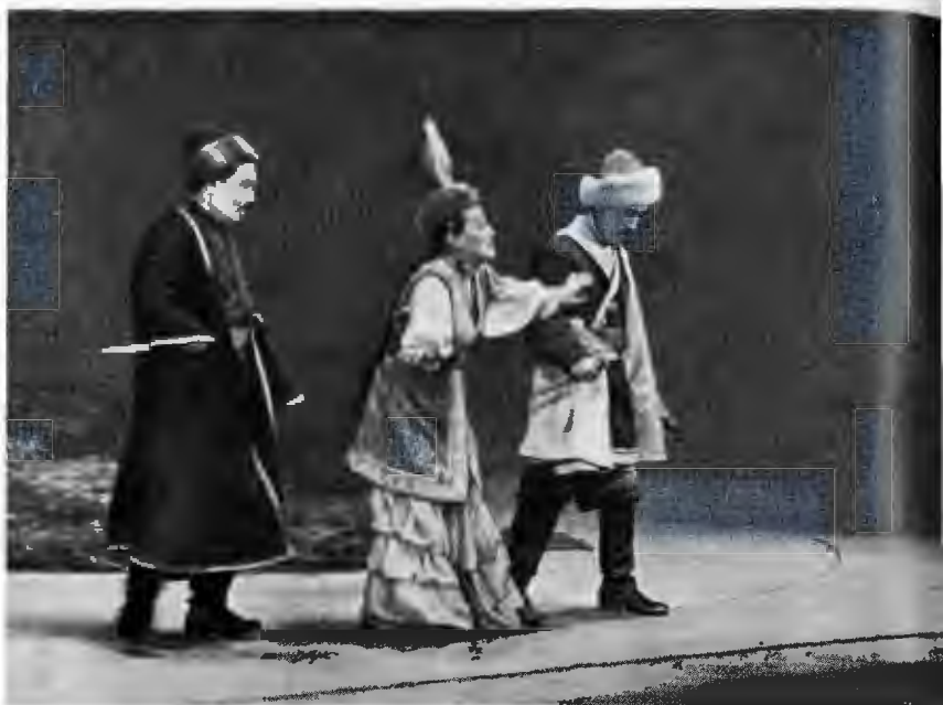
«Еңлік — Кебек» Корей театрының сахнасында.