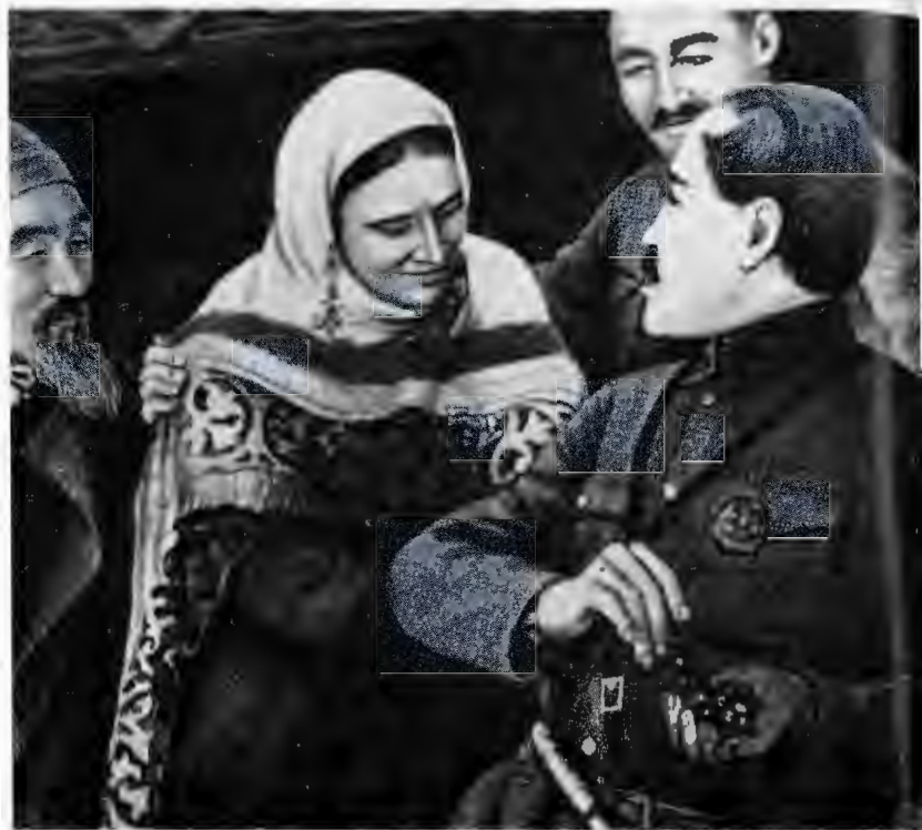
«Түнгі сарын» спектаклінен көрініс.