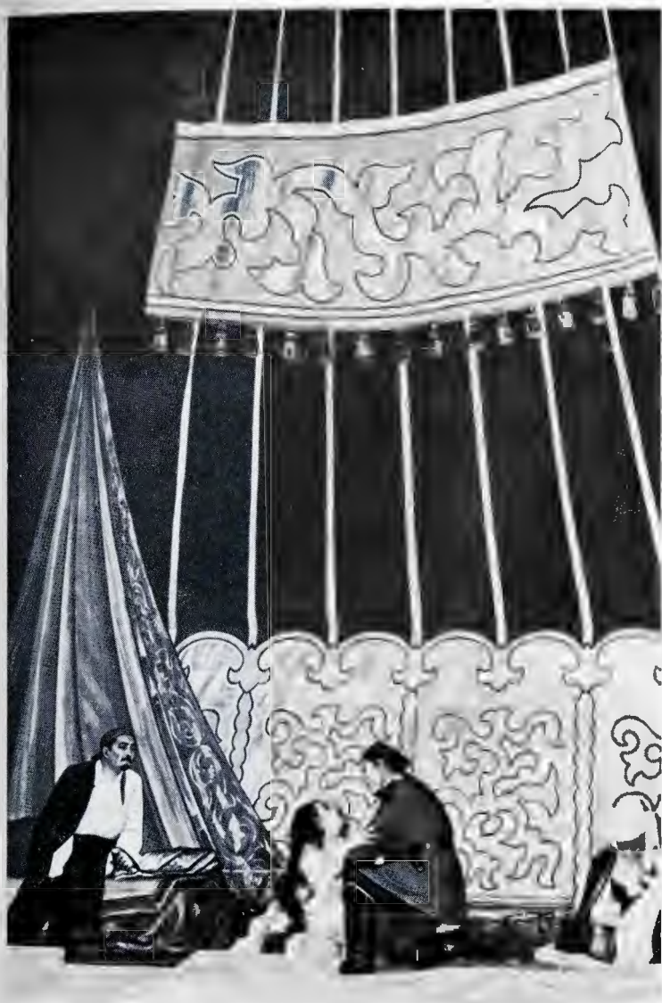
«Қаракөз» спектаклінен көрініс.