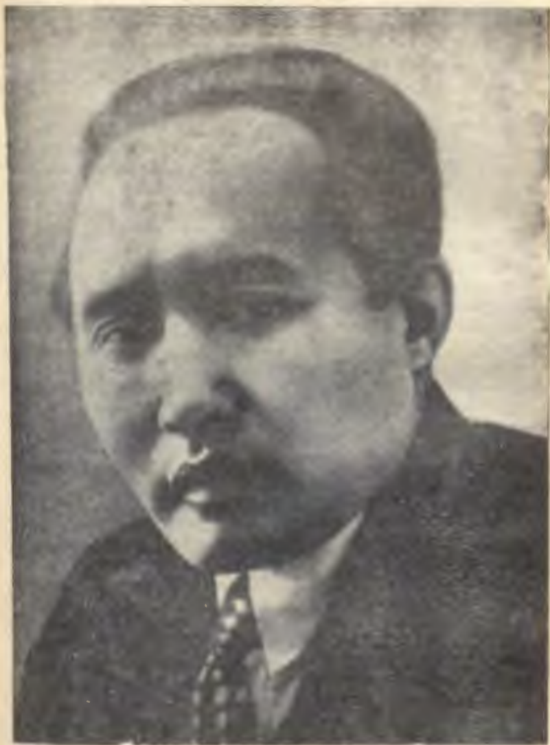
Мұхтар Әуезов. Отызыншы жылдар.