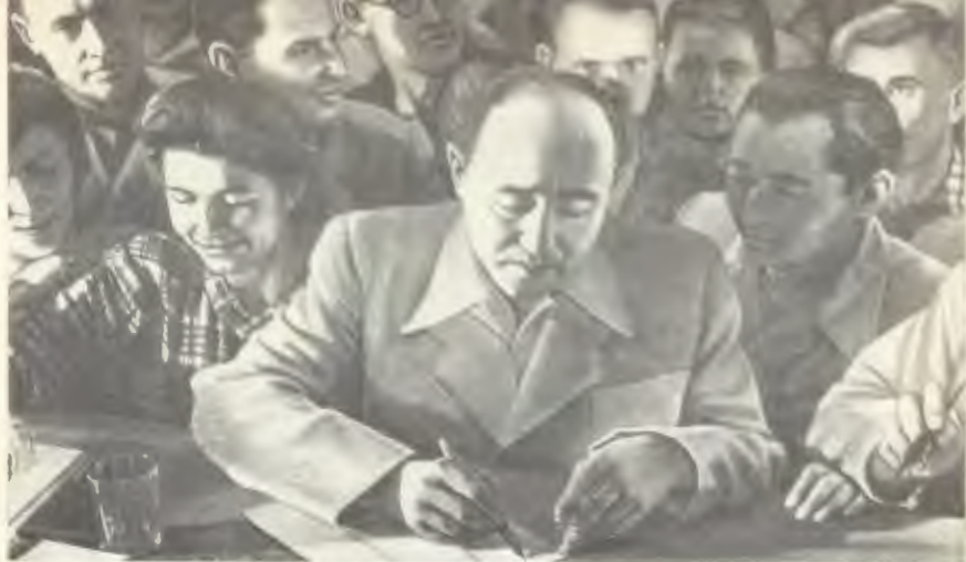
Мұхтар Әуезов студенттер арасында.