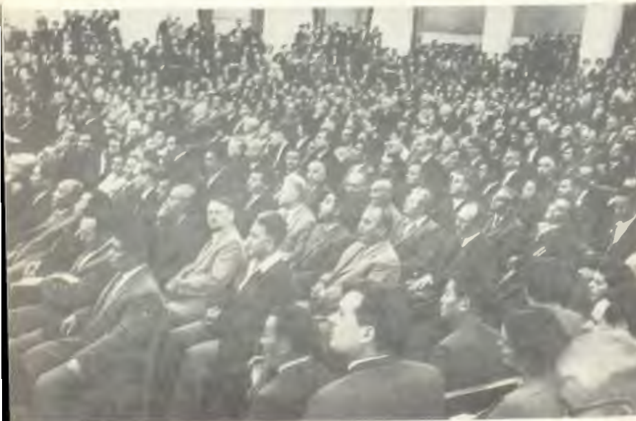
Мұхтар Әуезов Шығыстану халықаралық конгресінде. Москва, 1960 ж.