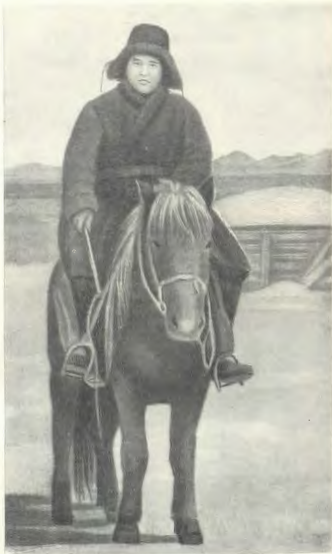
Мухтар Әуезов. 1928 ж.