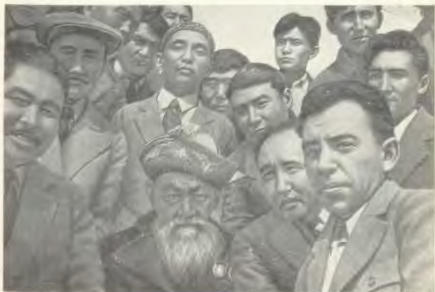
Мұхтар Әуезов Жамбыл бастаған ақын, жазушылар арасында. 1936 ж.