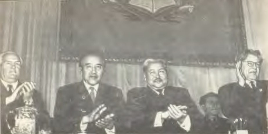
Мұхтар Әуезов Москвада болған қазақ әдебиеті мен өнерінің онкүндігінде. 1958 ж.