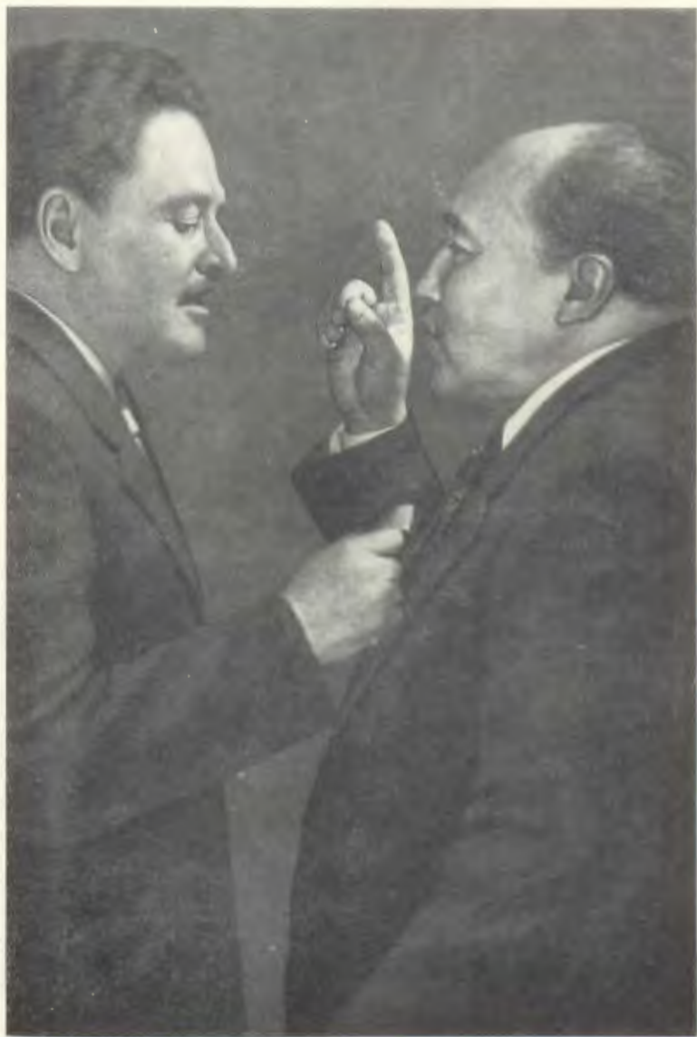
Мұхтар Әуезовтің Назым Хикметпен әңгімелесіп тұрған кезі.