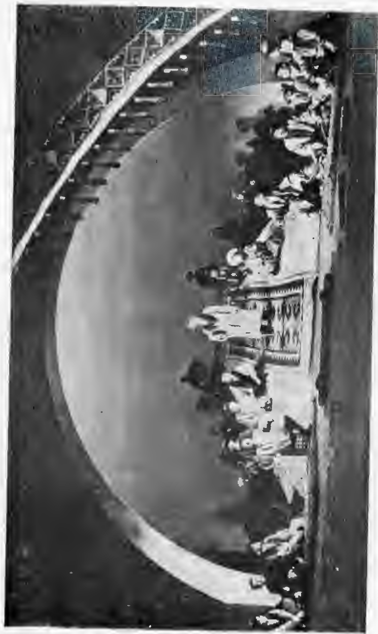
«Абай» спектаклінің көрінісі.