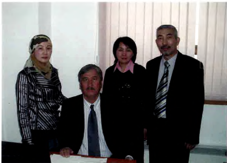
Ежелгі және орта ғасырлар әдебиеті бөлімі. 2