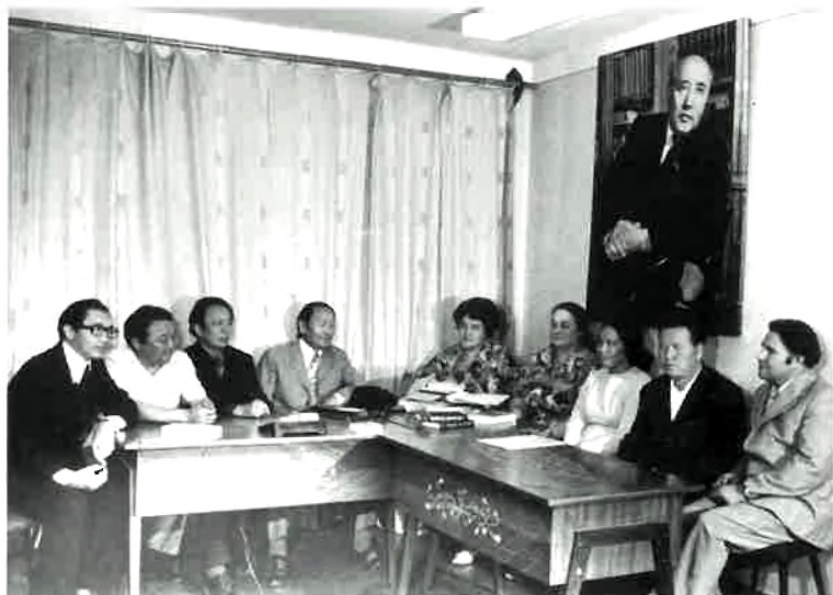
«Әуезов үйі» ғылыми-зерттеу орталығының қызметкерлері.