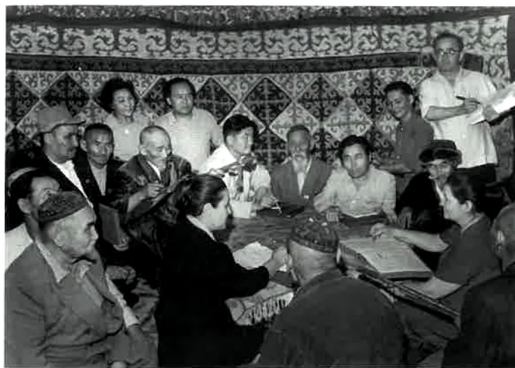
Институт қызметкерлері халық ақындарымен кездесуі.