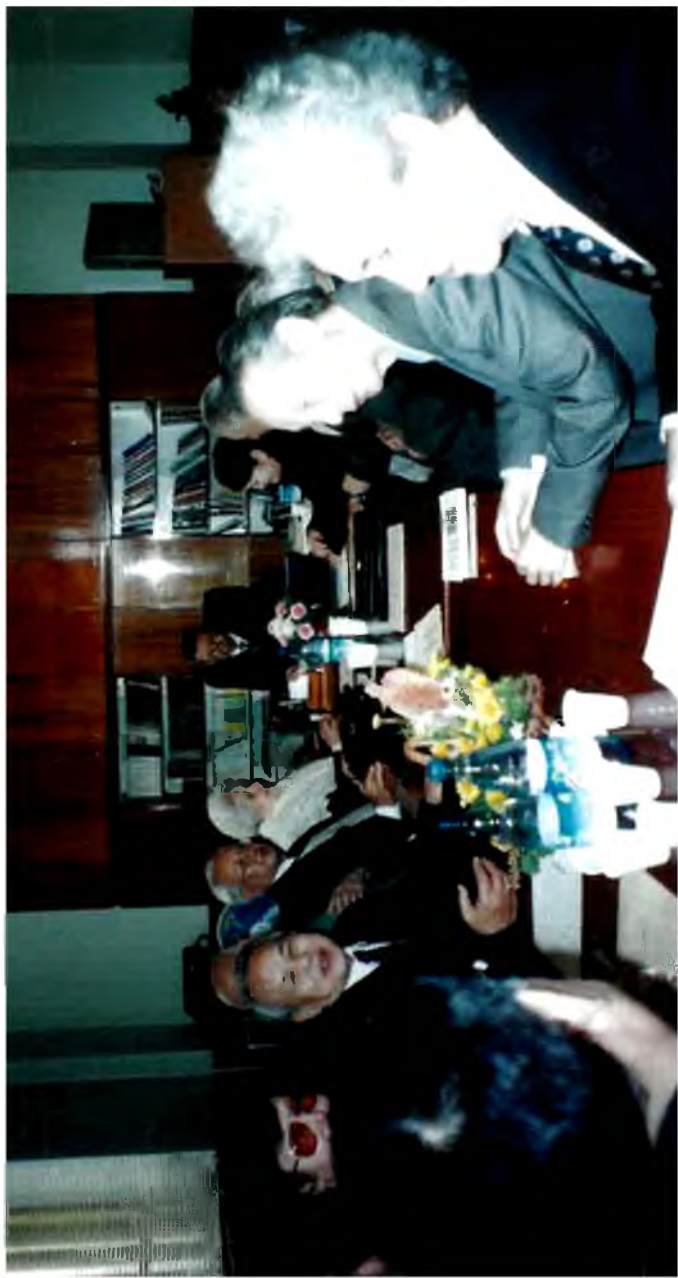
Ғылыми кеңес мәжілісі.