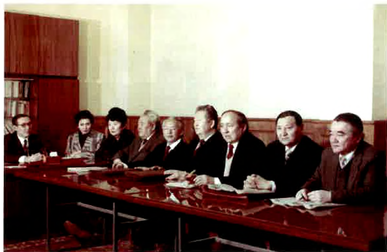
Ғылыми кеңес мүшелерінің бір тобы.