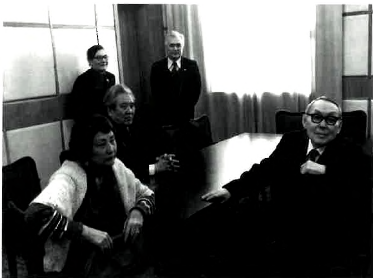
Институт қызметкерлерінің жазушы Ғ. Мүсіреповпен кездесуі.