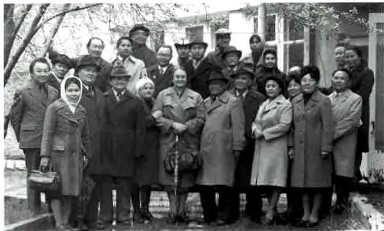
Институт қызметкерлері М. Әуезов мұражайында.