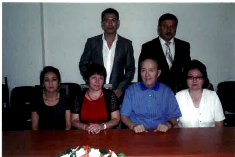
Әлем әдебиеті және халықаралық байланыстар бөлімі.