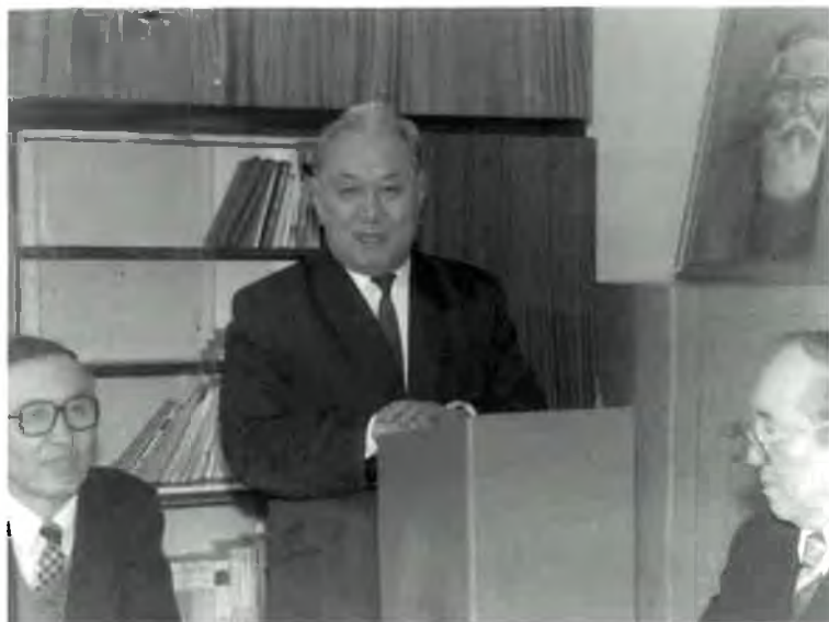
Академик З. Қабдолов мінбеде.