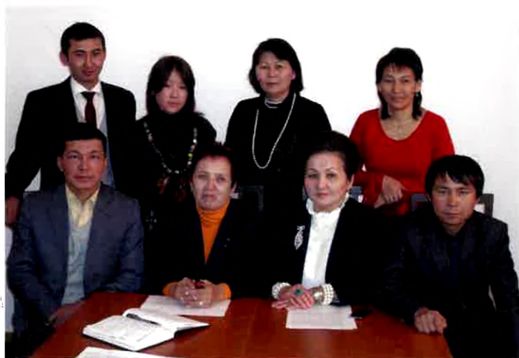
Әдебиет теориясы бөлімі.