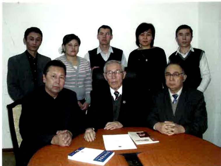
Тәуелсіздік дәуіріндегі әдебиет бөлімі қызметкерлері.