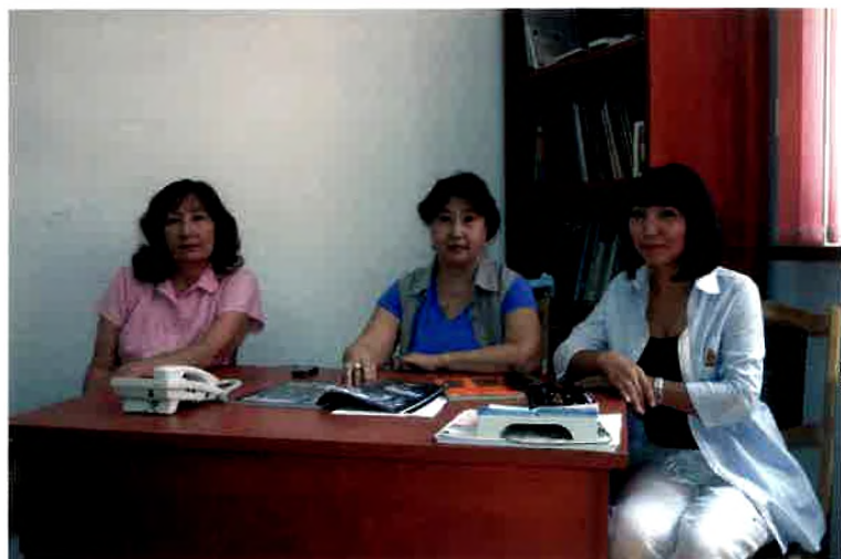
Бейнелеу өнері бөлімі.