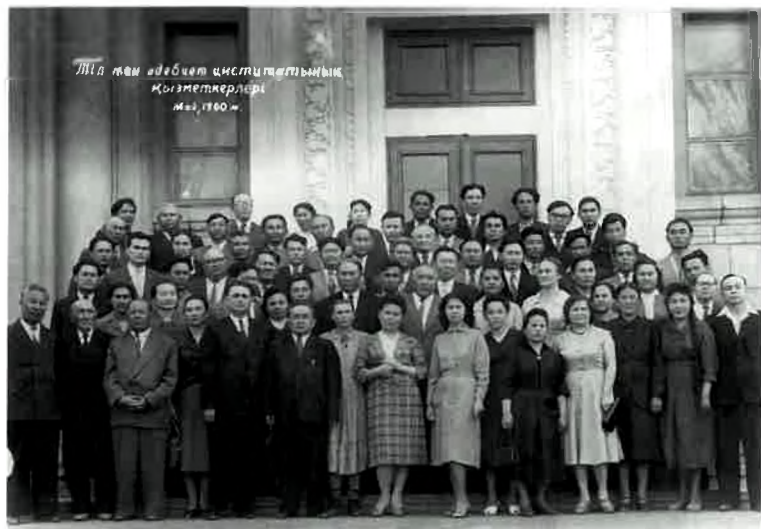
М. Әуезов Тіл және әдебиет институты қызметкерлерімен бірге.