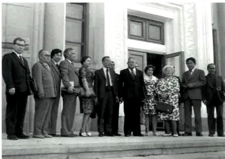
Ғылыми конференциядан кейін.